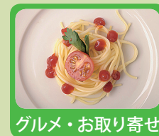
グルメ・お取り寄せ