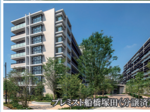
プレミスト船橋塚田(分譲済)