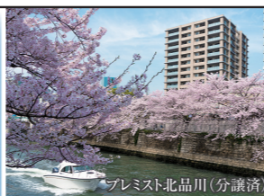
プレミスト北品川(分譲済)