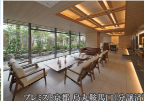
プレミスト京都 烏丸鞍馬口(分譲済)