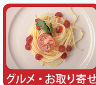
グルメ・お取り寄せ